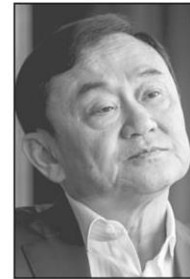
ทักษิณ ชินวัตร

● ไม่เฉพาะพวกลี้ล้อที่ลำบาก “นายใหญ่” ทักษิณ ชินวัตร ก็ใช้ว่าจะสุขสบาย ขนาดหนีร้อนไปต่างแดน ก็โดนสั่งจำคุกเพิ่มอีก 2 ปีในคดีโกงหอยบนดิน ถือเป็นคดีที่ 2 ที่ศาลฎีกาแผนกคดีอาญาของผู้ดำรงตำแหน่งทางการเมืองตัดสินโดยพิจารณาหลังจกจ่าย บวกเพิ่มจากที่เจอ 3 ปีคดีเอ็กซีเอ็ม แแบงก์ปล่อยกู้พม่า วิชากรรมยังไม่หมด ยังมีอีก 2 คดีรออยู่ คือ กรณีการปล่อยกู้ของธนาคารกรุงไทย จำกัด (มหาชน) ให้แก่บริษัทในเครือกฤษตามหานคร กว่า 9.9 พันล้านบาท ซึ่งโทษหนักกว่า 2 คดีนี้เสียอีก เพราะศาลฎีกา มีคำพิพากษาจำคุกพวกที่ร่วมในคดีนี้ไปแล้วคนละ 18 ปี นอกจากนี้ยังมีกรณีการแปลงสัญญาสัมปทานกิจการโทรคมนาคมเป็นภาษี